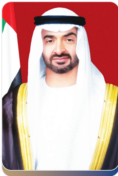
صاحب السمو الشيخ محمد بن زايد آل نهيان (حفظه الله) رئيس دولة الإمارات العربية المتحدة

"الثروة الحقيقية والمكسب الفعلي للوطن يكمن في الشباب الذي يتسلح بالعلم والمعرفة، باعتبارهما وسيلةً ومنهجًا يسعى من خلالهما إلى بناء الوطن، وتعزيز منعته، في كلِّ موقع من مواقع العطاء والبناء".