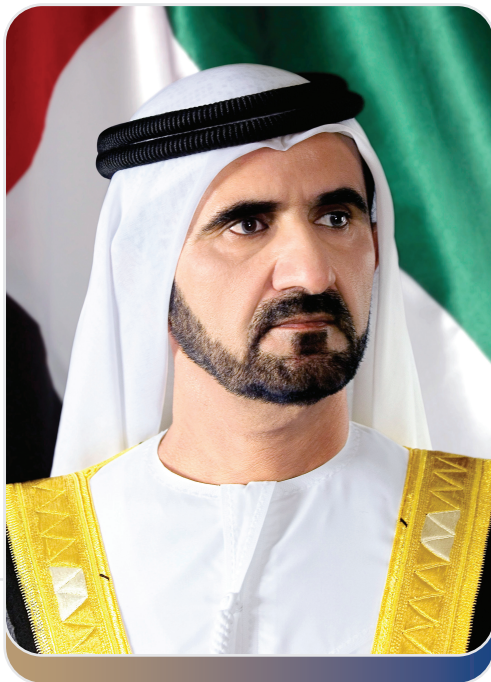
صاحب السمو الشيخ محمد بن راشد آل مكتوم (رعاه الله) نائب رئيس الدولة – رئيس مجلس الوزراء – حاكم دبي

"التفوق الحقيقيّ أساسه إدراك قيمة العلم، وأثر المعرفة في تطوير حياتنا إلى الأفضل."