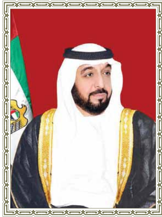
صاحب السّموّ الشّيفخ خليفة بن زايد آل نهيان حفظه الله رئيس دولة الإمارات العربيّة المتّحدة

”إنّ تعليم الناس وثقيفهم في حدّ ذاته ثروة كبيرة نعتز بها، فالعلم ثروة ونحن نبني المستقبل على أساس علمي“.