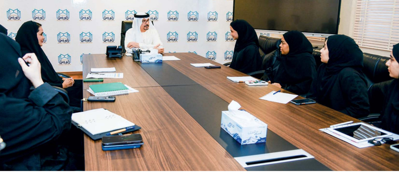
اجتماع سعادة مدير جامعة الوصل مع المجلس الطلابي المنتخب

وأكد سعادته على دور المجلس في تنمية الوعي الوطني، وغرس قيم المجتمع الإماراتي لدى الطلبة، ونشر ثقافة الحياة الجامعية. ودعا إلى الاهتمام بالأنشطة اللاصفية الفنية منها، والثقافية والعلمية، وإقامة الندوات وتنظيم المحاضرات الطلابية، والقيام بالرحلات العلمية والثقافية لمختلف مؤسسات الدولة، والعمل على دعم مواهب الطلبة واكتشافها في مختلف المجالات، لما لها من دور مهم في تنمية شخصية الطالب، وتنمية مهارات الخطابة والكتابة، والتنظيم، ومفهوم العمل الجماعي، والعمل ضمن فريق، وتنمية مهارات المسؤولية وحسن القيادة لدى الطلبة، واكتساب مهارات التواصل، والقدرة على التفكير الناقد وحل المشكلات.