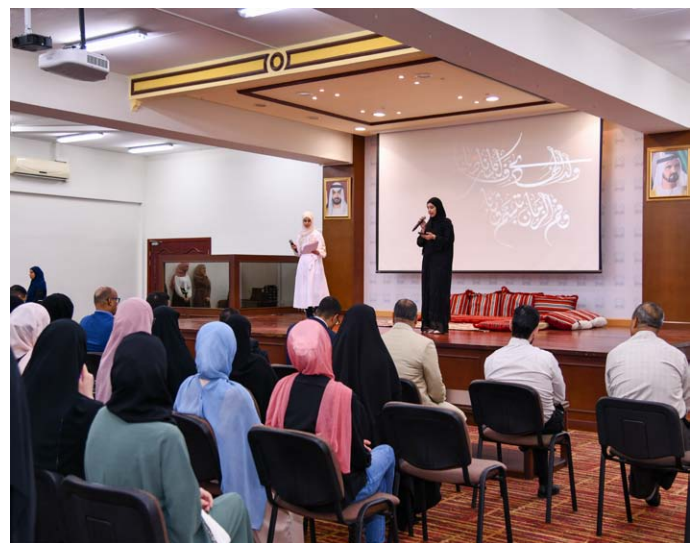
صور من الفعالية