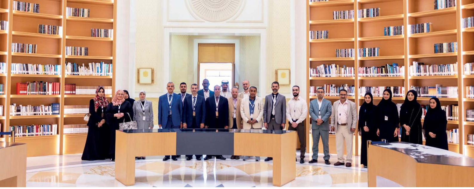
زيارة وفد جامعة الوصل لمكتبة قصر الوطن

إبداع العمارة العربية والإسلامية، بوصفها أحد المعالم المعرفية والمعمارية في دولة الإمارات العربية المتحدة، ثم استمع الوفد خلال الجولة إلى شرح مفصّل عن محتويات المكتبة وأقسامها المتنوعة، التي تضم مجموعة كبيرة من الكتب، ومصادر متنوعة في مختلف مجالات العلوم والفنون من المخطوطات والمؤلفات النادرة؛ إذ تحتوي المكتبة على أكثر من خمسين ألف عنوان عمل معرفي، تمّ جمعها على مدار أكثر من 35 عاماً، وجرى الاطلاع على جناح "بيت المعرفة" الذي يحتوي على معروضات وأعمال فنية نادرة، تلقي الضوء على العصر الذهبي للحضارة العربية وإسهاماتها في مختلف المجالات. وقام الوفد بزيارة جناح دولة الإمارات الذي يحتوي على مجموعة من الكتب والمؤلفات عن دولة الإمارات وبلدان مجلس التعاون الخليجي.