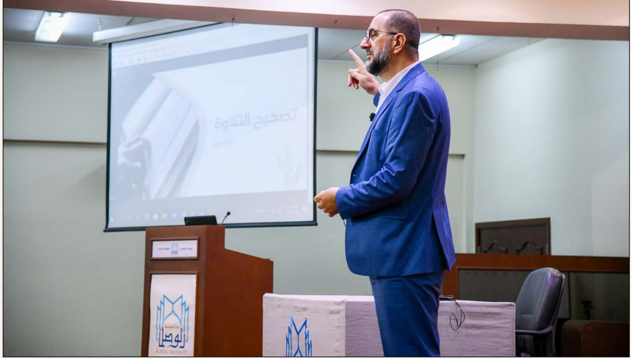
الدكتور سلور إشريتش

نظمت كلية الدراسات الإسلامية صباح يوم الثلاثاء الموافق 8-11-2022 ورشة بعنوان: (مبادئ علم التجويد) قدمها الدكتور / سلور إشريتش وشارك فيها عدد من طلبة الجامعة وأساتذتها.