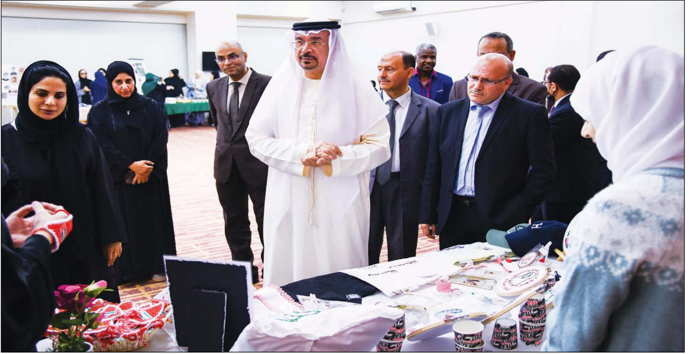
مدير الجامعة يطلع على منتجات المعرض

اجتماعية مهمة كالعرس وغيره. مع الشيلة التي تغطي الرأس والشعر، وتصنع من قماش خفيف، وقد تزينت بخيوط ذهبية أو فضية.