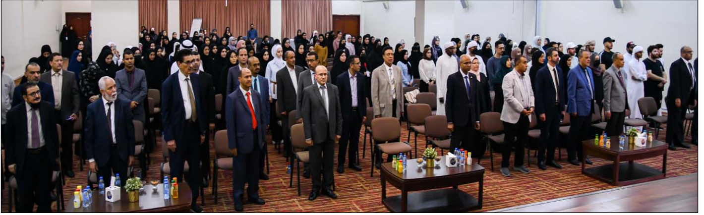
جانب من الباحثين وضيوف المؤتمر وأعضاء الهيئة التدريسية في حفل الافتتاح

وفي كلمته قال الأستاذ الدكتور صالح بلعيد رئيس المجلس الأعلى لغة العربية بالجزائر إن المؤتمر يتناول قضايا مهمة منها اللغة العربية وقضايا التحول إلى الرقمنة، وأشار إلى أهمية التحول الرقمي في اللغة العربية، وضرورة ردم الفجوة بين اللغة العربية والتكنولوجيا لمسايرة ركب الحضارة والمستجدات العلمية والفكرية. ودعا إلى رفع الأمية الرقمية، وإغنائها في مجال المصادر والمراجع المتاحة إلكترونياً. وقدم مقترحاً بإنشاء مؤسسة عربية مقرها جامعة الوصل بعنوان: (المؤسسة العربية للمحتوى الرقمي)، وإنشاء المدونة اللغوية العربية.