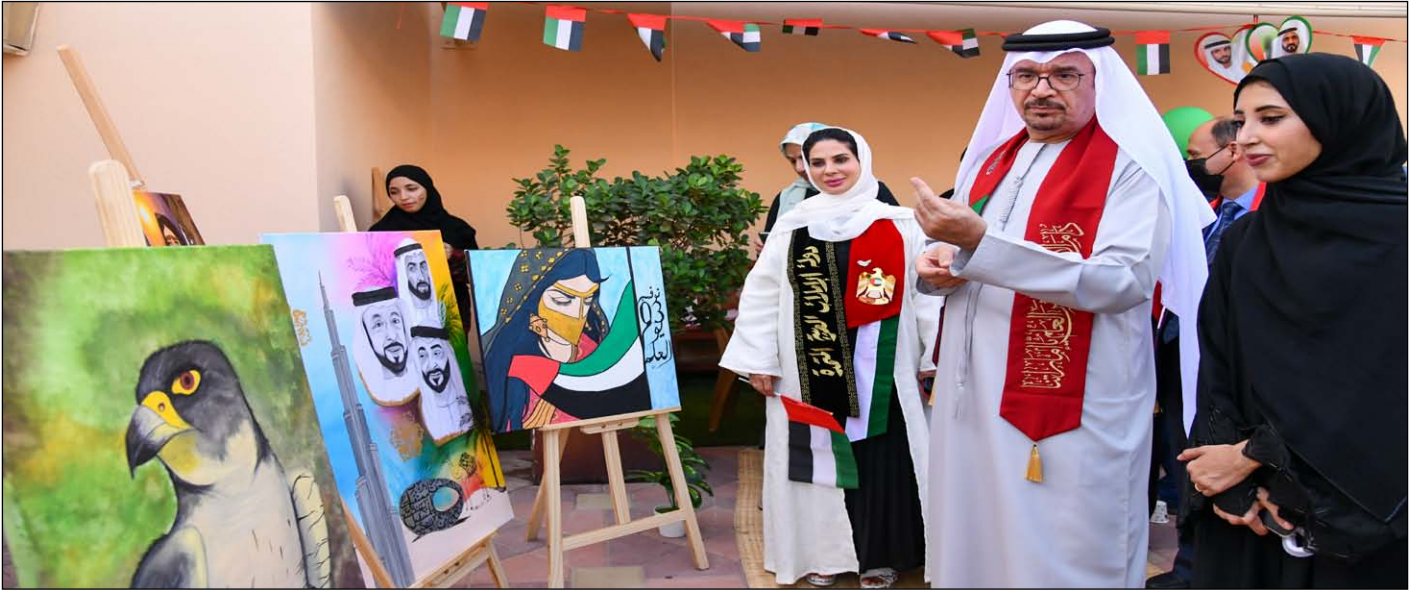
مدير الجامعة في معرض الاتحاد

في بناء صرح الاتحاد العظيم، ومسابقات تنافس الجميع طلبةً وأساتذةً في تخمين الإجابات الصحيحة عن الأسئلة التي دارت حول معاني كلمات من اللهجة الإماراتية أو أمثال شعبية.