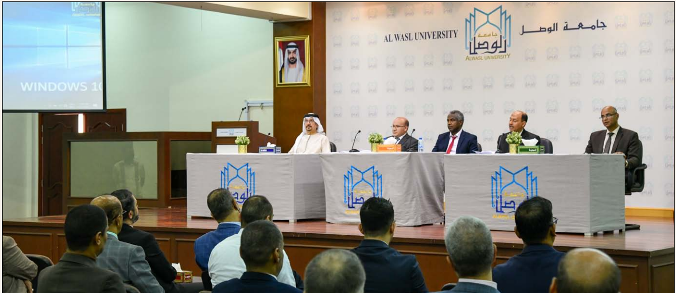
مدير الجامعة في لقائه مع أعضاء الهيئة الأكاديمية