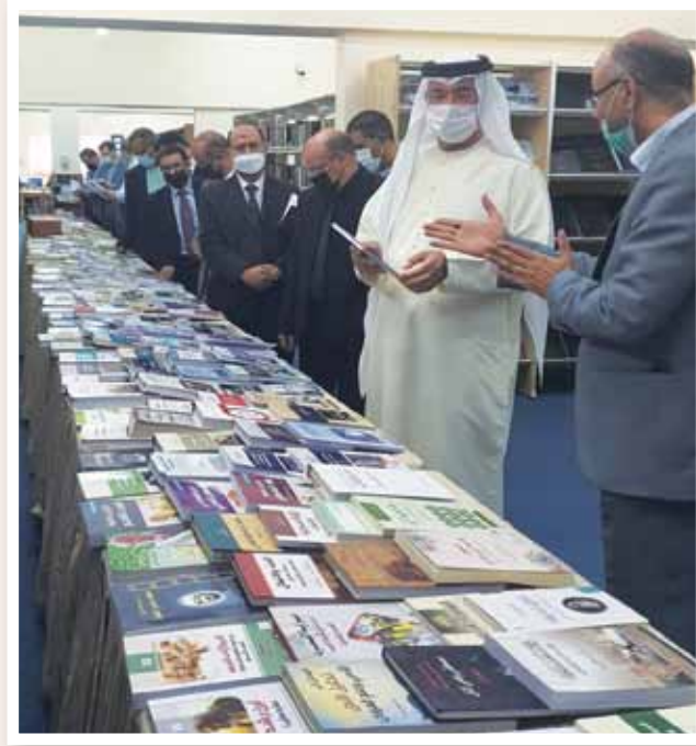
مدير الجامعة يفتتح معرض الكتب الجديدة بحضور نواب مدير الجامعة وعدد من أعضاء الهيئة التدريسية

على أهمية المكتبة الرقمية وسهولة وصول الطالب إلى المراجع والمصادر والاطلاع على محتواها من أي مكان وفي أي وقت.