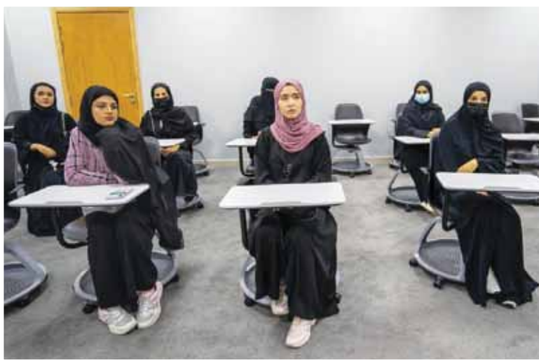
جانب من الطالبات المشاركات في الزيارة

المستغنامي إلى جهودِ صاحب السَّموِّ الشَّيخ الدكتور سلطان بن محمَّد القاسمي، عضو المجلس الأعلى حاكم الشارقة، في رعاية هذا المشروع ولمَّ شمل الجامع العربيَّة لإنجاز المعجم التاريخي للغة العربيَّة، وأكَّد على أنَّ إنجاز المعجم