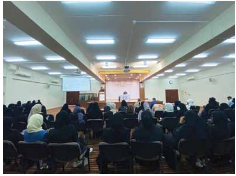
جانب من الحضور في محاضرة أثر الخواطر على حياتنا اليومية التي قدمها الدكتور عبد الرؤوف محمود أستاذ العقيدة ومقارنة الأديان بجامعة الوصل

فيما أشار الدكتور عبد الرؤوف محمود إلى ضرورة التمييز بين الخواطر، (وهو ما يرد على القلب من أفكار) فمعظم الأمراض النفسية تبدأ بخاطرة، فهناك خاطرة "الخير"، وخاطرة "الشر"، وهناك مشاركات عن مفهوم الخواطر، وأسبابها، وأقسامها وطرق دفعها والتعامل معها. وفي ختام المحاضرة فتح باب المناقشة أمام طلبة الجامعة.