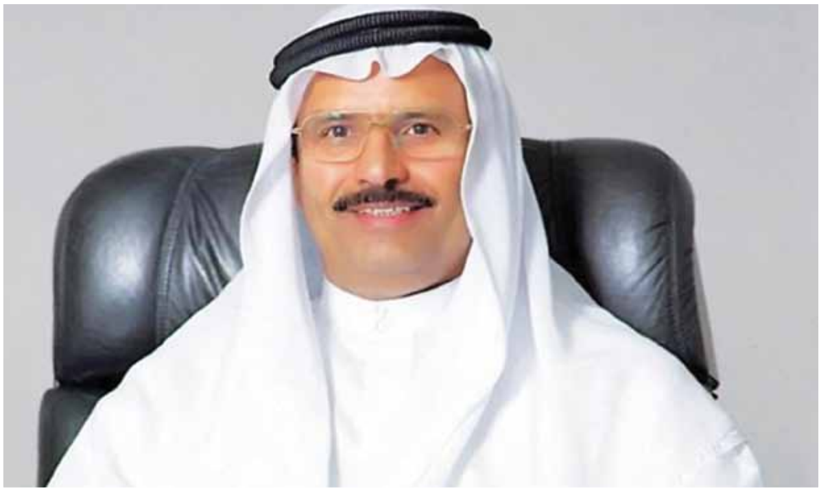
معالي أحمد حميد الطاير نائب رئيس مجلس أمناء الجامعة

عقد مجلس أمناء جامعة الوصل ثلاث اجتماعات دورية خلال العام الجامعي 2021-2022م، استعرض فيها أهم المستجدات العلمية والأكاديمية والبرامج الجديدة المطروحة على المجلس. ترأس جلسات المجلس معالي أحمد حميد الطاير نائب رئيس مجلس أمناء الجامعة