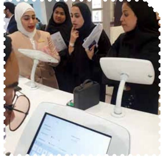
معرض الإمارات للوظائف 2019 مركز دبي التجاري العالمي