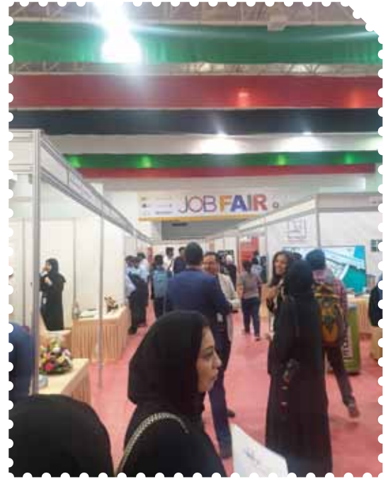
معرض التوظيف 2019 الجامعة الأمريكية - رأس الخيمة