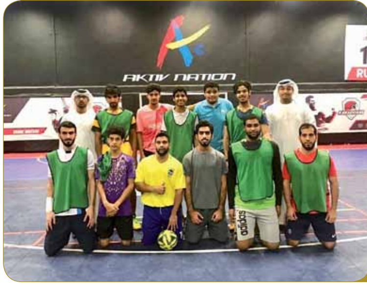
جانب من مشاركة طلاب جامعة الوصل في البطولة الرياضية لمدينة دبي الأكاديمية DIAC