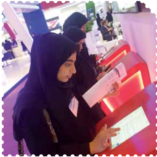
المعرض الوطني للتوظيف 2019 مركز اكسبو الشارقة