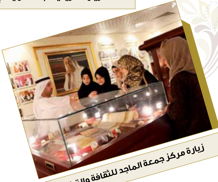
زيارة مركز جمعة الماجد للثقافة والتراث