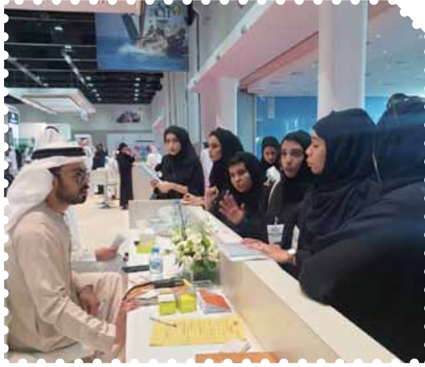
معرض توظيف 2019 مركز أبوظبي الوطني للمعارض