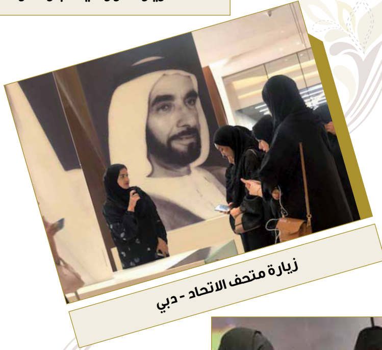
زيارة متحف الاتحاد - دبي