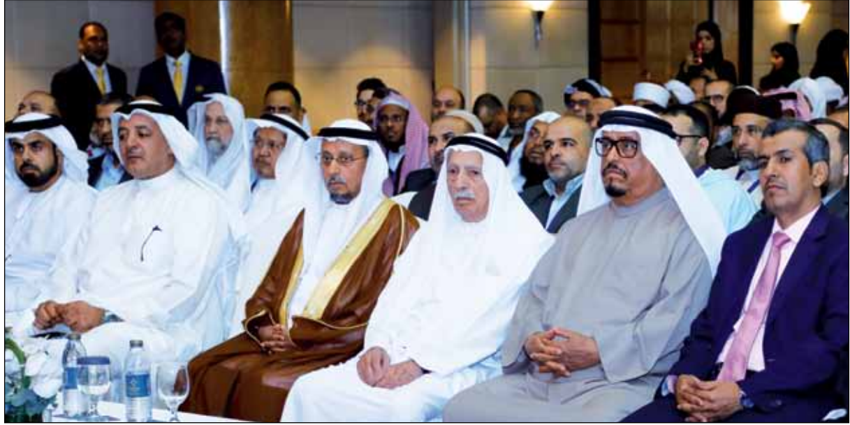
معالي الفريق ضاحي خلفان والسيد جمعة الماجد في اليوم الثاني من فعاليات الندوة

محاضرة بعنوان الأمن الشامل في حماية الوطن ضاحي خلفان: دبي باتت أنموذجاً يحتذى في الأمن الشامل بكافة أنواعه وأنظمتها