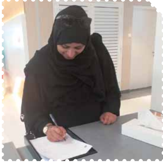
اليوم المفتوح للتوظيف وزارة الموارد البشرية والتوطين - الفجيرة