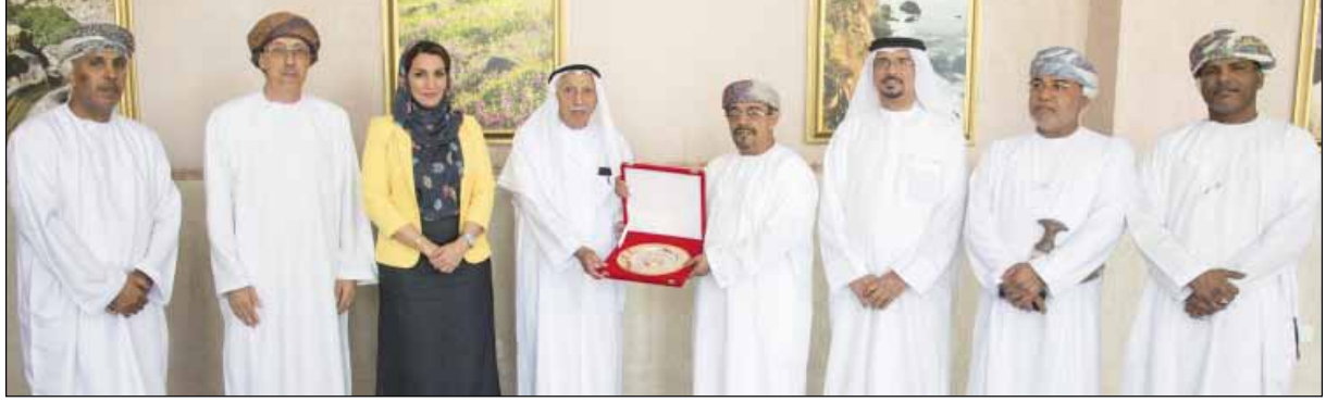
سعادة الدكتور علي بن سعود البيماني رئيس جامعة السلطان قابوس يسلم السيد جمعة الماجد درع الجامعة

مشيرا إلى أن جامعة الوصل ومركز جمعة الماجد للثقافة والتراث متاحين لجميع طلبة جامعة السلطان قابوس والباحثين للاستفادة من الخدمات العلمية والثقافية والمراجع و نفاثس الكتب والمخطوطات والوثائق التي يستفيد منها الباحثون سواء بالحضور أو عن طريق التواصل الإلكتروني، لافتا إلى أن هدف الزيارة يأتي بغرض التنسيق مع جامعة السلطان قابوس للاستفادة من خبراتها وتوسيع أطر التعاون مع أقسامها والمراكز التابعة لها، متوجها بالشكر لجميع القائمين على جامعة السلطان قابوس على حفاوة الاستقبال متمنيا أن تكون نتائج هذه الزيارة مثمرة وتصب في خدمة طلبة المؤسسات وتبرز مكانة البحث العلمي.