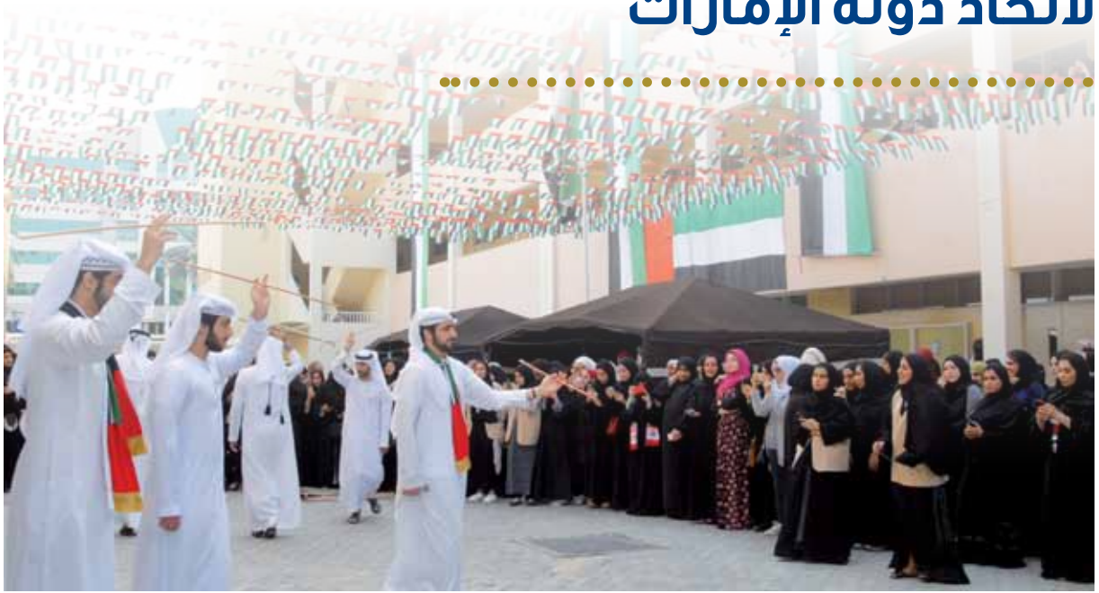
احتفالات الجامعة باليوم الوطني الـ 47 لاتحاد دولة الإمارات

إلى قيادة دولة الإمارات العربية المتحدة وشعبها ، مؤكداً حرص الجامعة على أن تكون جزءاً من المشهد الاحتفالي، من خلال فقرات تستذكر روح القائد المؤسس الشيخ زايد بن سلطان آل نهيان طيب الله ثراه من إعداد طلبة وطالبات الجامعة، وقال: ”إن احتفالية هذا العام ليست ككل عام فهي مقترنة بمناسبة غالية على قلوبنا مناسبة ”مئوية عام زايد“؛ حيث استذكرت فقرات الحفل جهود المغفور له وإرثه الكريم وإنجازاته العظيمة التي أنارت دروبنا، وضمنت لنا حياة كريمة في كل المجالات وسارت عليها قيادتنا الرشيدة إلى أن وصلت بنا حدود السماء ونافسنا كبرى الدول“.