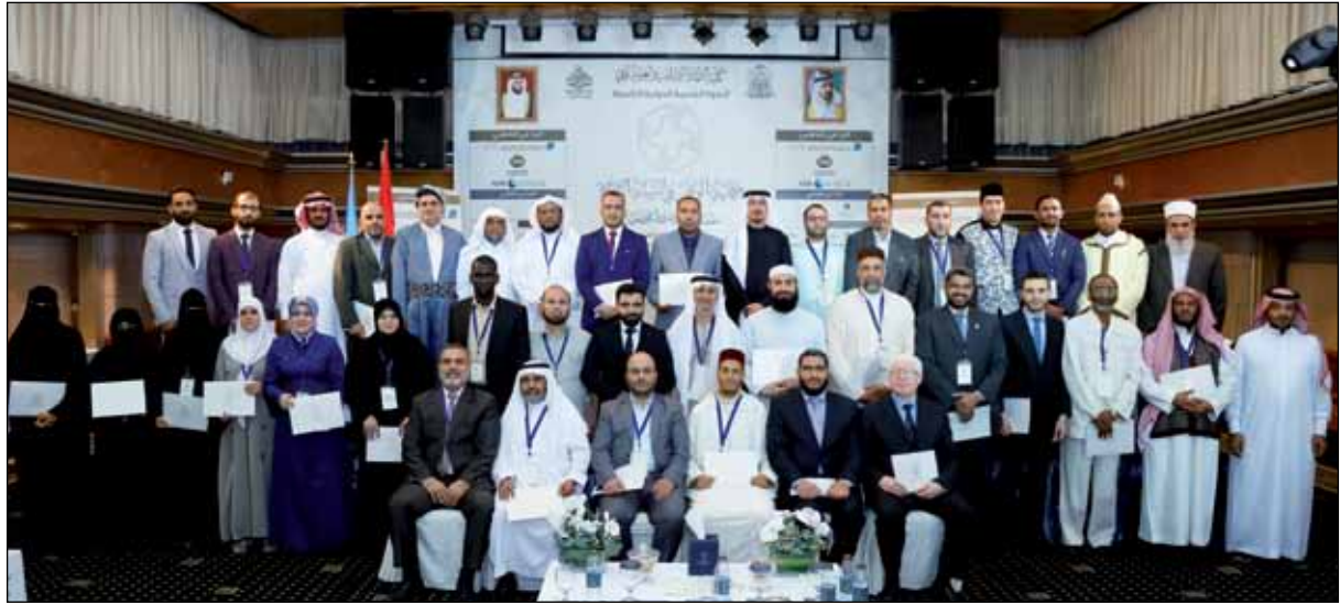
بحضور مدير الجامعة صورة تذكارية للباحثين المشاركين في ندوة الحديث التاسعة

وقد أشاد بالقائمين والمنسقين في هذه الندوة؛ حيث قال: (على الرغم من مشاركتين في أكثر من خمسة عشر مؤتمراً دولياً لكن لم أر اهتمام وتنظيم وترتيب مثل هذه الندوة، متابعة من اللجنة العلمية والإدارية حتى من الأمين العام وغيرهم؛ فكل ذلك له أثره في نضوج هذه الندوة إلى مستواها المطلوب، سألين الله أن تكون نافعة، وأن تعمم على باقي الدول إن شاء الله).