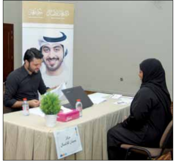
اليوم المفتوح لمركز عجمان للاتصال - دبي

وجاءت الشواغر المطروحة من قبل المؤسسات المشاركة في وظائف (خدمة العملاء، ومراكز الخدمة الهاتفية، والعلاقات العامة، وحجوزات والمالية).