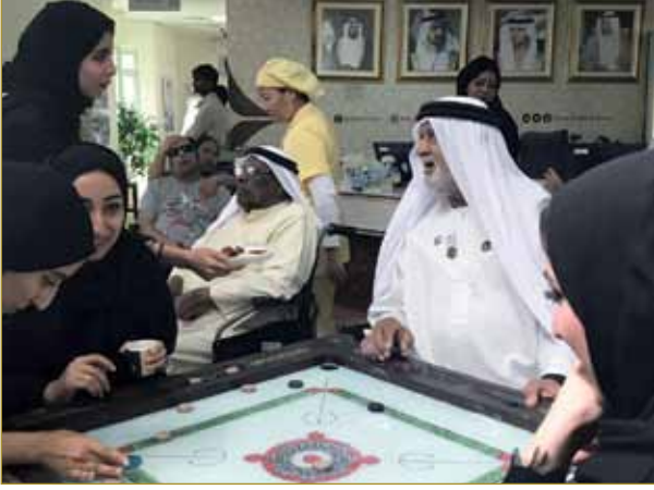
زيارة دار رعاية كبار المواطنين