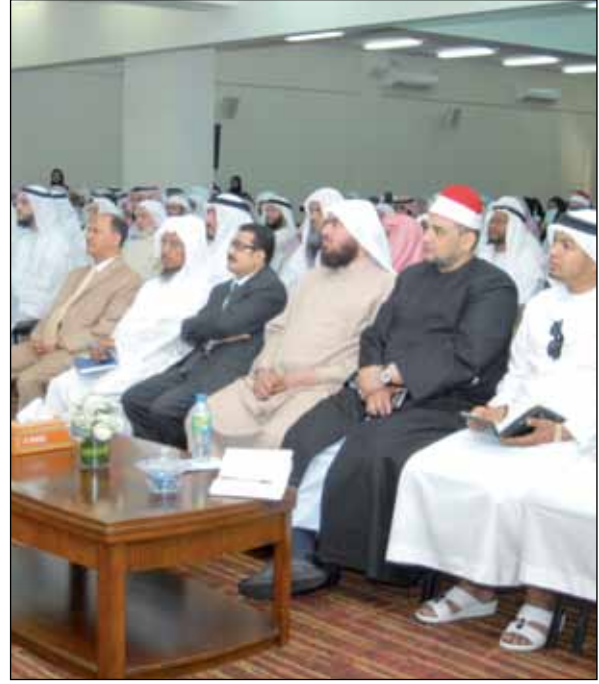
نخبة من العلماء والباحثين والمفتيين وأساتذة الجامعة المشاركين في فعاليات الأسبوع الثقافي

واختتمت الفعالية بوصية المسلمين على حفظ السنة والدفاع عنها؛ فإن ذلك من الدفاع عن دين الله عز وجل.“