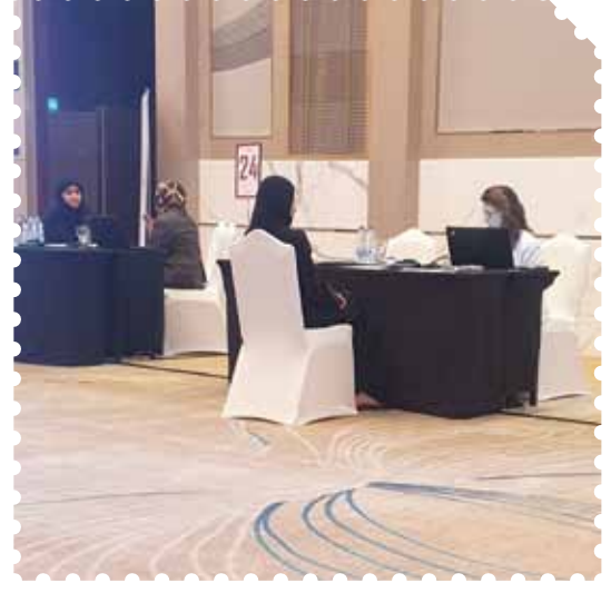
اليوم المفتوح للتوظيف وزارة الموارد البشرية والتوطين - دبي