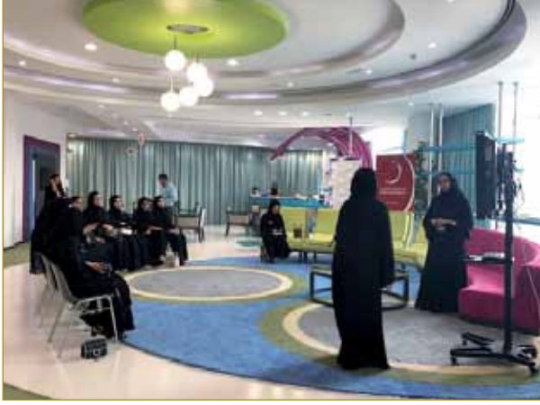
زيارة تعريفية لجامعة زايد في دبي