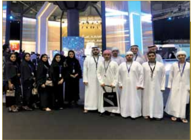
زيارة المنتدى الدولي للاتصال الحكومي - مركز اكسبو الشارقة