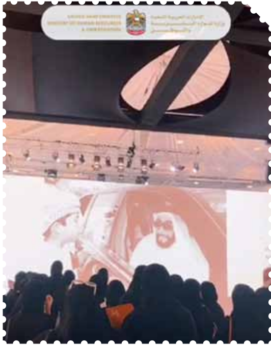
منتدى الطلبة توظيف 360 وزارة الموارد البشرية والتوطين - الفجيرة