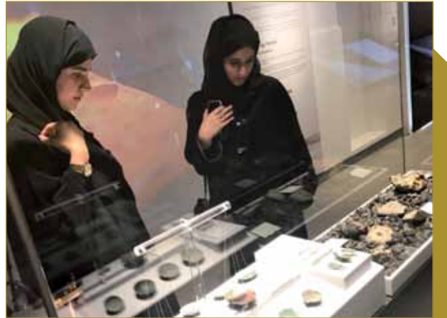
زيارة متحف ساروق الحديد - دبي