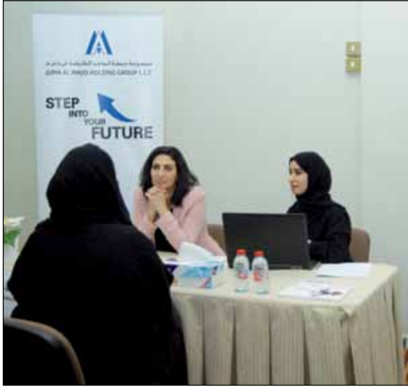
اليوم المفتوح لمجموعة جمعة الماجد القابضة - دبي